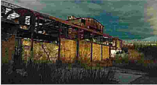
Abbandono Una delle fotografie in concorso per l'iniziativa promossa dall'Acer, l'Associazione dei costruttori romani

Immagini di periferie nella Galleria Sordi